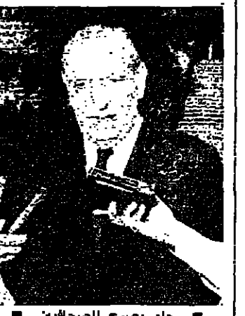
حلو يصرح للصالحين

كثف رئيس الجمهورية الشيخ امين الجميل امس لقاءاته واتصالاته لمعالجة الازمة السياسية والامنية في البلاد، لا سيما في ضوء التحركات الجارية على الساحة المسيحية لتحديد مواقف مختلف الفقاء من موضوع الحوار والاصلاحات.